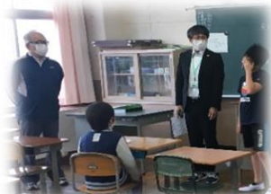
朝の会で話す校長先生

学校オープン5分前。昇降口前に間隔をあけて並ぶ市田っ子。気付き・考え・行動できる高学年。さすがです。