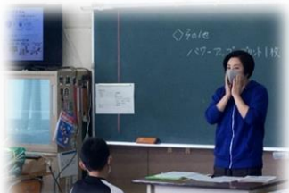
ウイルスから身を守る方法を学習しました。(各学年)