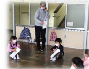
自己紹介する1年生